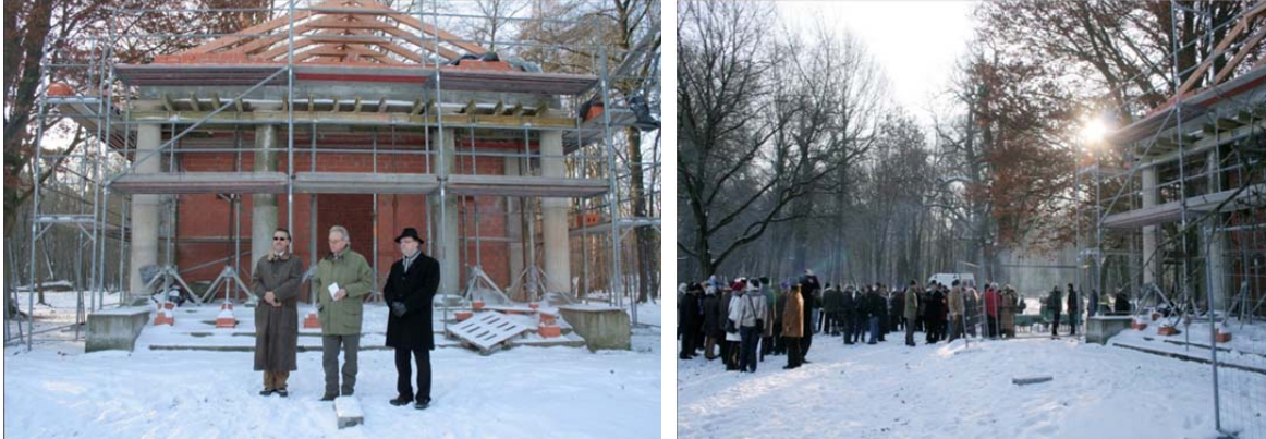
Richtfest an der Solitude bei klirrender Kälte

Die Kulturstiftung DessauWörlitz bemüht sich gemeinsam mit dem Rotary Club Dessau darum, den Waldpark Sieglitzer Berg wieder attraktiv zu machen. „Es ist die reizendste Wildnis, die ich kenne“, schrieb Fürst de Ligne 1799. Den festlichen Abschluss von Rohbau und Zimmererarbeiten bildete das Richtfest, das die Mitarbeiter der Stiftung am 4. Dezember 2010 gemeinsam mit dem Rotary Club Dessau feiern konnten. Das Projekt wird außer vom Rotary Club Dessau mit Denkmalpflegemitteln des Landes Sachsen-Anhalt und von Lotto Sachsen-Anhalt gefördert.