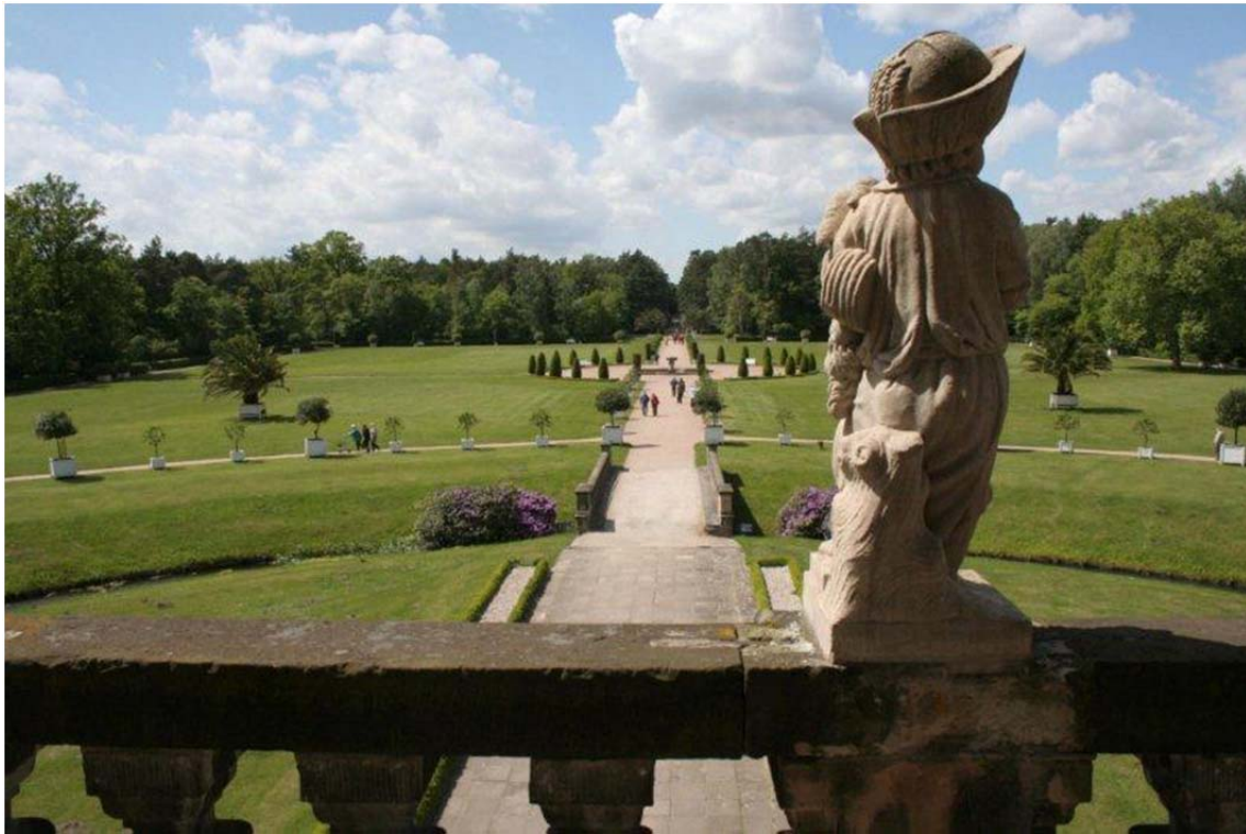
Ausblick vom Altan in den Schlosspark Oranienbaum