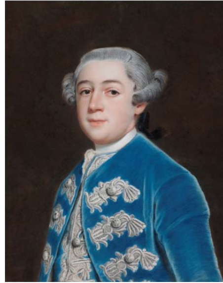
Leopold III. Friedrich Franz von Anhalt Dessau (1740-1817), um 1758