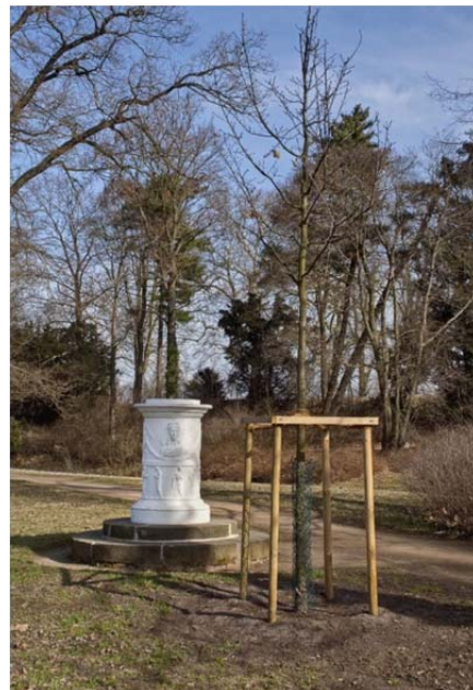
Neupflanzung am Warnungsaltar