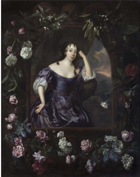
Albertine Agnes von Oranien-Nassau, spätere Fürstin von Nassau-Diez (1634-1696)