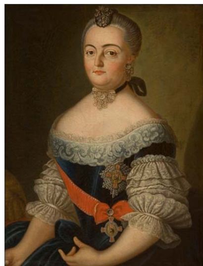
Henriette Amalie Prinzessin von Anhalt-Dessau