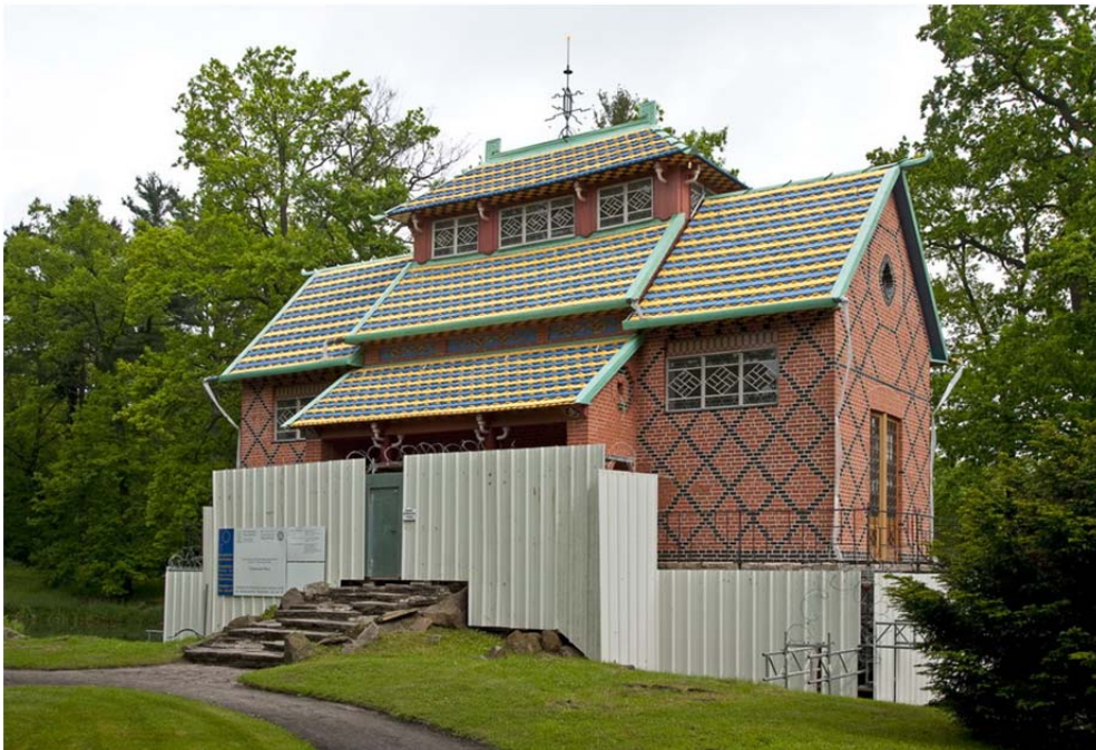
Chinesisches Haus in Oranienbaum

Ein Projekt, welches über das Kulturinvestitionsprogramm der EU (KIP) gefördert wird, ist die Restaurierung des Chinesischen Hauses in Oranienbaum. Hier fanden sich bei den Arbeiten zur Restaurierung der Dächer zahlreiche Dachziegelfragmente, die Reste von blauen und gelben Anstrichen zeigten und auf eine völlig unerwartete Farbigkeit der Dachlandschaft hinwiesen (Detail siehe Titelseite). Die Befunde und zeitgenössische Abbildungen erlaubten es, diese leuchtende blau-gelbe Farbfassung zu rekonstruieren. Anschließend wurde die Wetterfahne wieder aufgestellt. Vor den Fenstern wurden so unauffällig wie möglich Gitter aus Edelstahldraht angebracht, um sie vor Steinwürfen zu schützen. Die Blitzschutzanlage wurde so konzipiert, dass sie bei voller Funktionsfähigkeit das Erscheinungsbild des Gebäudes so gut wie gar nicht beeinträchtigt. Am 28. Mai 2010 konnte die restaurierte Außenhaut des Gebäudes der Öffentlichkeit vorgestellt werden.