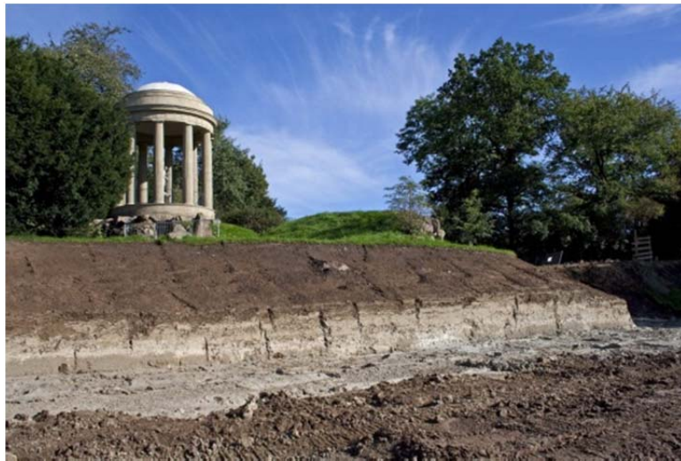
Oben: Wörlitzer Elbdeich am Venus-tempel

Die ursprüngliche Zielstellung, bis zum Saisonbeginn 2011 alle Arbeiten zur Wiederherstellung des Spazierweges auf der Deichkrone, der historischen Stufenanlagen und Gartensitze sowie den nun wieder möglichen Pflanzungen von Großgehölzen in den Deichböschungen weitgehend fertig zu stellen, konnte nicht realisiert werden. Infolge andauernder extremer Niederschläge, den beiden Hochwassern im September 2010 und Januar 2011 sowie dem bereits seit Mitte November eingetretenen Wintereinbruch werden die Arbeiten voraussichtlich noch bis in den Sommer 2011 andauern. Der Deichabschnitt zwischen der Wassermühlensfahrt und dem Pantheon konnte für den Besucherverkehr bereits am 1. Dezember 2010 freigegeben werden. Von den Mitarbeitern der Gartenabteilung erfolgten im gesamten unmittelbaren Umfeld des Deiches eine Vielzahl von Restaurierungsarbeiten am Gehölzbestand und die Wiederherstellungsarbeiten von Sichtbeziehungen.