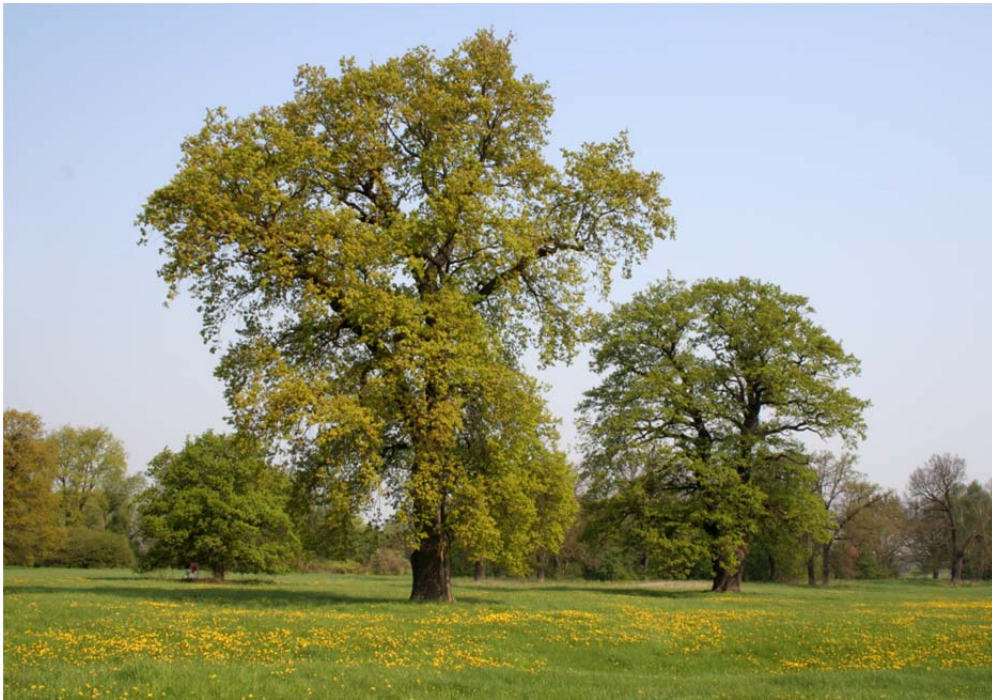
Im Gartenreich lassen sich vielerorts mächtige Solitäreichen finden.

Erste Schritte in Richtung Hartholzauenwaldentwicklung wurden bereits im Frühjahr 2010 unternommen. Auf einer Fläche von 1,5 ha wurden Stieleichen, Feldulmen, Eschen, Wildbirnen und Wildäpfel sowie Vogelkirschen gepflanzt. Mit der Realisierung des „Life + - Projekts“ erfährt das Natura 2000 Gebiet „Dessau-Wörlitzer Elbauen“ eine deutliche Aufwertung und langfristige Sicherung.