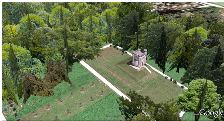
Das Schlangenhaus und der umgebende Garten im Luisium in Ansichten um 1800, 1818 und 2010