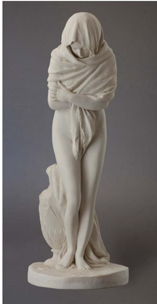
Wunderschön: Die Frileuse

Eine erotische Spielerei zierte ursprünglich das Gotische Zimmer in der Luisenklippe: die sich drehende Gestalt einer von der Taille abwärts unbedeckten Houdon-Skulptur. Aus Privatpenden konnte die Skulptur rekonstruiert werden. Bis zur Wiederaufstellung befindet sie sich im Zentraldepot der Stiftung.