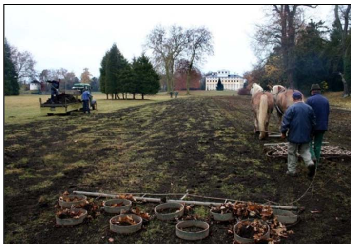
Ausbringen von Kompost in den Wörlitzer Anlagen

Weitere 550 m 3 an Hochwertkomposten stehen bereits für das Vegetationsjahr 2011 zur Ausbringung bereit. Mit der Anschaffung eines dafür geeigneten Kompoststreuers konnte die schwere manuelle Handarbeit auf den freien Flächen zum Teil reduziert werden. Die Ausbringung des Kompostes in den dichten Vegetationsflächen kann aber weiterhin nur in Handarbeit erfolgen.