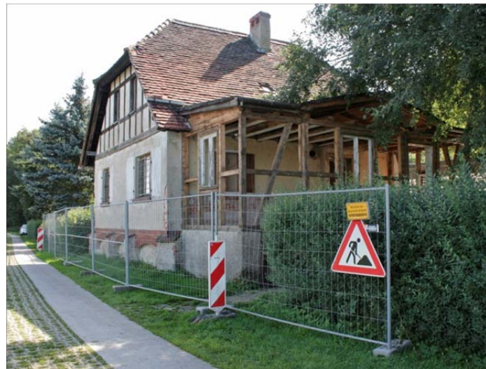
Das Forsthaus an der Rosenwiesche

Nach einem aufwendigen Genehmigungsverfahren, welches den Bedingungen des Standortes (Hochwasserschutzgebiet, Naturschutzgebiet, geschützte Fledermäuse) und der Substanz (Denkmalschutz) gerecht werden musste, konnte im August 2010 mit der Baumaßnahme begonnen werden. Immer wieder wurden die Arbeiten von Hochwasserereignissen unterbrochen. Zu der nötigen Grundsanie rung gehört die Instandsetzung der großen Mauerwerksrisse, des Daches, des Fachwerks, der Fenster, der Türen und der Dielungen. . Es wurde statisch soweit ertüchtigt, dass selbst bei einer großen Flut die Standsicherheit erhalten bleibt. Die durchgehende Sperrung in der Ebene des Erdgeschossfußbodens sorgt dafür, dass das Gebäude gleich nach dem Rückgang jedes Hochwassers wieder genutzt werden kann. Von der anstelle des jüngeren Vorbaus errichteten Veranda werden Besucher einen spektakulären Blick genießen