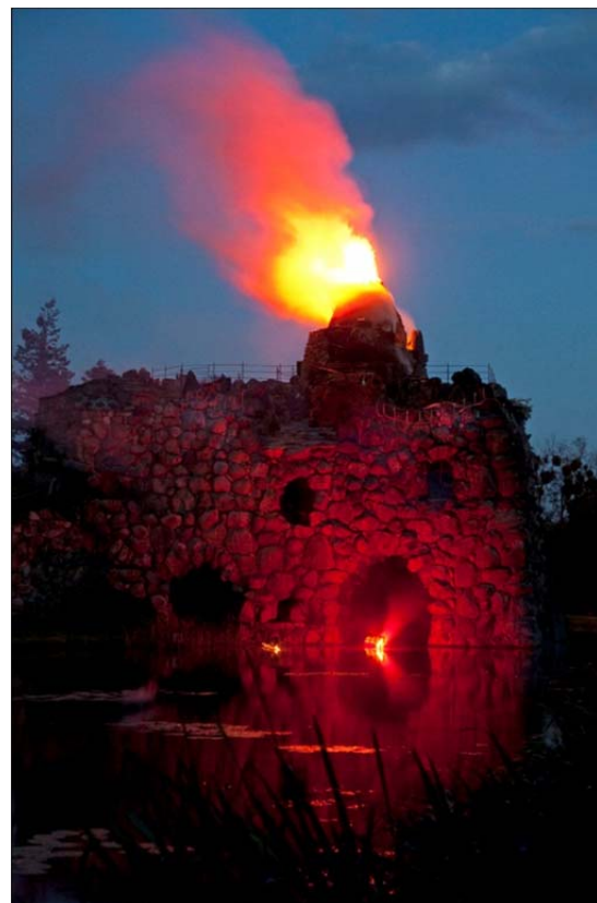
Vulkanausbruch in Wörlitz