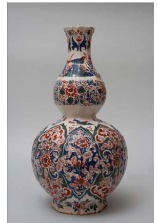
Die Kürbisvase befindet sich nun im Schloss Mosigkau