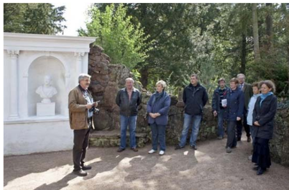
Erläuterungen im Labyrinth

Im Labyrinth und am Eisberg von Neumarks Garten konnten die bereits 2008 begonnenen Wiederherstellungsarbeiten abgeschlossen werden. Am 27.04.2010 erfolgte die feierliche Übergabe im Rahmen einer Pressekonferenz. Bis zum Jahresende konnten auch die Fertigstellungsarbeiten an den Neupflanzungen beendet werden.