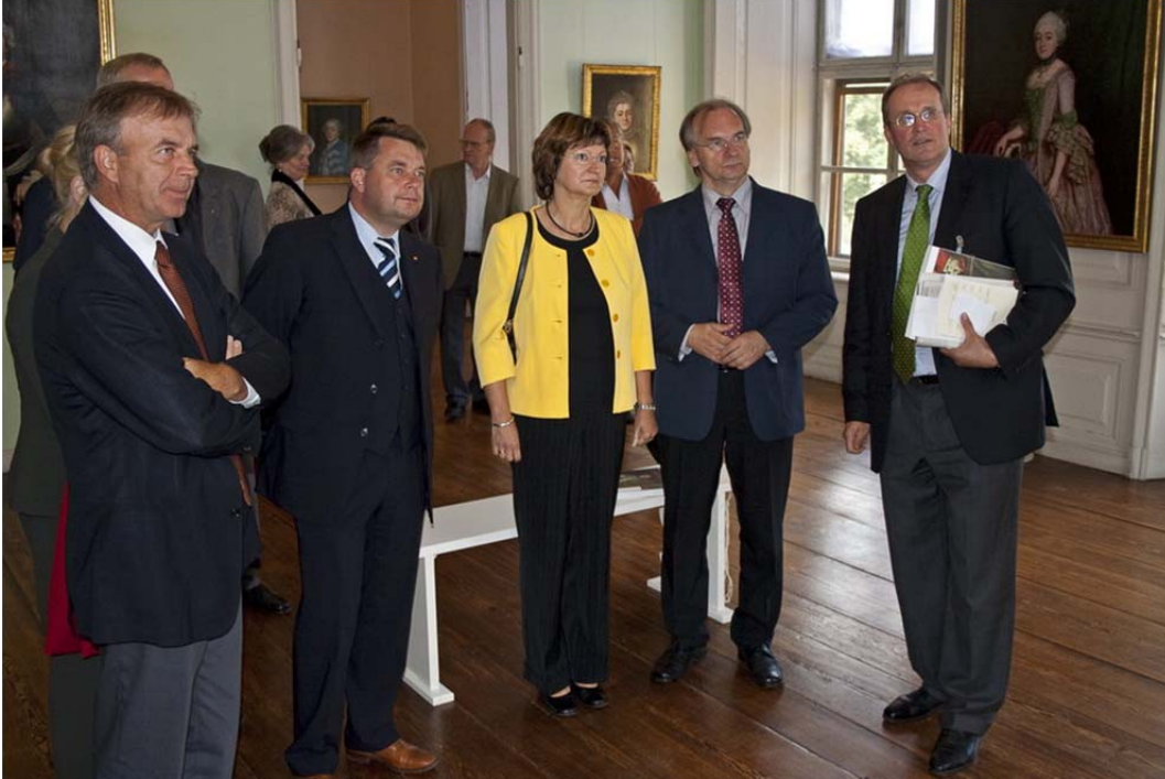
Der Kurator führt Ehrengäste durch die Ausstellung.

facher Hinsicht ein Erfolg! Zum ersten Male wurde die Zusammenarbeit mit einem bedeutenden deutschen Museum gesucht und ein gemeinsames großes Projekt zu Wege gebracht. Dabei konnten Wissenschaft, Museumsorganisation und -technik, Haushalt und Öffentlichkeitsarbeit erfolgreich vernetzt werden.