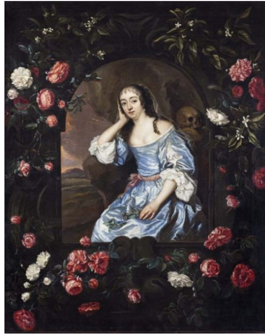
Maria von Oranien-Nassau, spätere Pfalzgräfin von Simmern (1642-1688)

Die beiden Frauen sind von einem ovalen, mit verschiedenfarbigen Rosen und Orangenblüten besetzten Kranz gerahmt. Aus der auffallenden Todessymbolik und dem Gestus der Melancholia, in dem beide Porträtierte gezeigt werden, ist zu schließen, dass die Porträts vermutlich kurz nach dem Tod des Ehemanns von Albertine zwischen November 1664 und Ende 1665 entstanden sind.